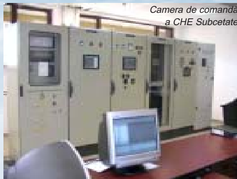
Camera de comandă a CHE Subcetate

Proiectarea și executarea de către U.C.M. Reșița a echipamentelor electrice, care vor putea fi livrate odată cu hidroagregatul ca parte a acestuia, precum și înființarea Centrului de Supraveghere și Diagnoză a Centralelor Hidroelectrice, dau companiei noastre posibilitatea de a oferi beneficiarilor produse și servicii de cea mai înaltă tehnologie în domeniul hidro.